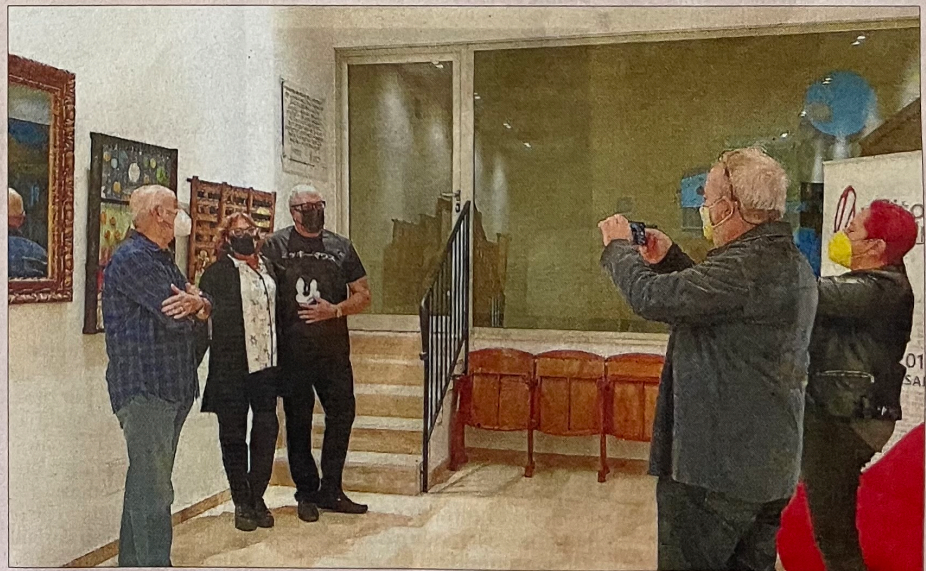
Los invitados a la inauguración aprovecharon para inmortalizar el momento.