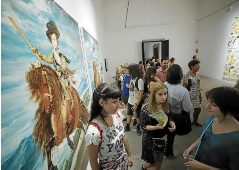
Imagen de la Nit de l'Art del año pasado; este 2020, no habrá aglomeraciones y la mascarilla es obligatoria.