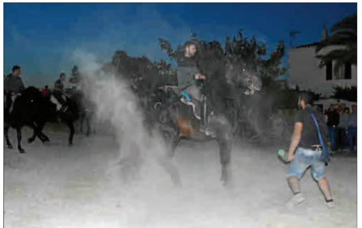
Los jinetes pusieron ayer a prueba sus monturas en el 'replec' de Son Mercer, de Ferrerries.

Al mismo tiempo ya han empezado los replecs , que tienen lugar en distintos llocs -fincas agr3cola-ganaderas- donde se concentran varios cavallers y caixers . En estos replecs , como el primero, celebrado en Son Mercer (Ferrerries), suena la m3sica del Jaleo y los jinetes deben mostrar su habilidad y dominio de las monturas. Los caballos caracolean y se encabritan, mientras son azuzados por los santjoaners , que ponen a prueba la destreza de los centauros menorquines.